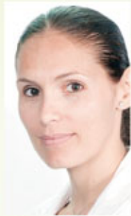
Virginia BONGO ONDIMBA